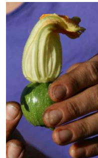
Fleur femelle (avec un mini fruit en dessous de la fleur).

Laisser se produire les premières courgettes et les récolter petites.