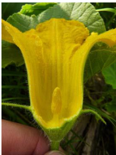
Fleur mâle, se trouve au bout d'une longue tige.

Facile sur courgette car les plantes ne sont pas rampantes et les fleurs sont grosses.