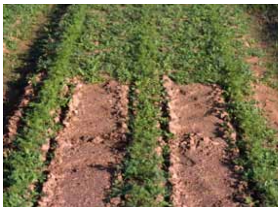
Avant/après passage du désherbeur thermique