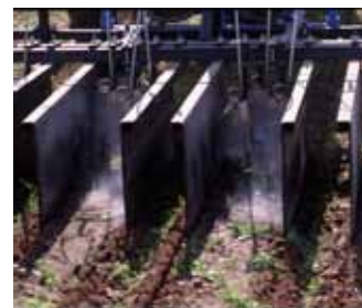
Brûleur avec cache pour brûlage entre-rangs