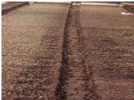
exemple d'enherbement obtenu avec un faux semis

L'intervention mécanique de post-semis prélevée n'est pas possible avec une herse étrille. En revanche, celle-ci peut être utilisée pour des interventions ultérieures en cours de culture, sur des espèces à enracinement profond (choux, poireaux, pomme de terre), ou sur une motte ayant bien repris.