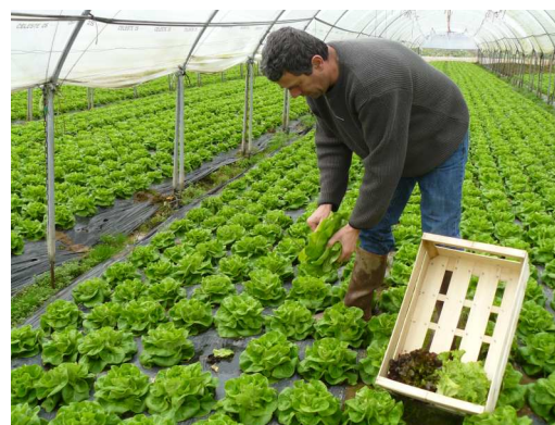
Salades sous tunnel