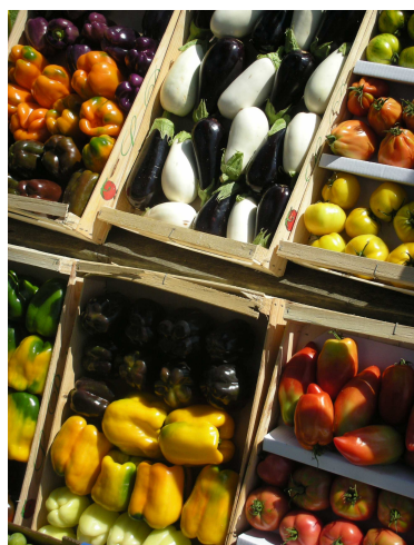
Poivrons, tomates, aubergines

Chaque année sa gamme évolue pour mieux l'adapter aux besoins.