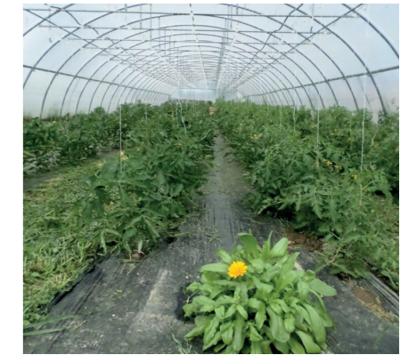
Gestion de couverts végétaux dans les allées sous-serre pour maîtriser l'enherbement et améliorer la structure du sol.

Bacillus thuringiensis sur choux, poireaux, tomates, blettes et épinards.