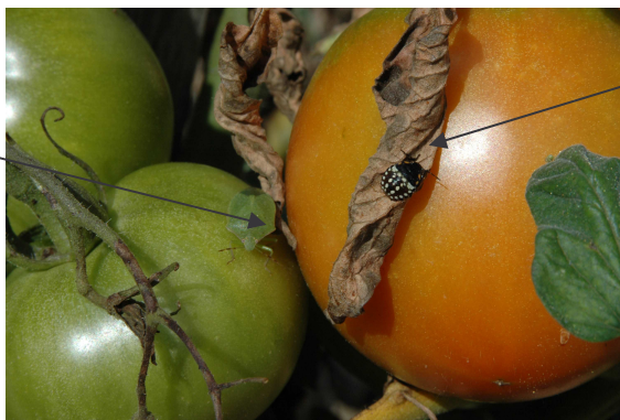
Larve de punaise

Description : L'insecte est piqueur-suceur, les adultes ont une forme d'écusson, verts au printemps et en été, bruns-violacés en automne et en hiver ; 1,2 à 1,6 cm de long et 0,8 cm de large. Les 3 premiers stades larvaires sont rouges foncés à noirs avec des taches blanches, les 2 derniers stades larvaires : verts avec des taches blanches, jaunes et rouges. Les oeufs sont groupés, blancs cassés, disposés en ooplaques, sur la face inférieure des feuilles.