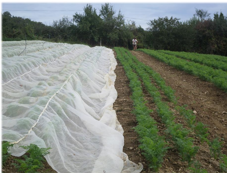
Photo du 18 août 2020 à Barjac (09) : les carottes de conservation (à gauche) sont déjà couvertes, les carottes de droite seront commercialisées en premier.

Voir itinéraire technique cultural: https://www.erables31.org/forum/viewtopic.php?f=27&t=12