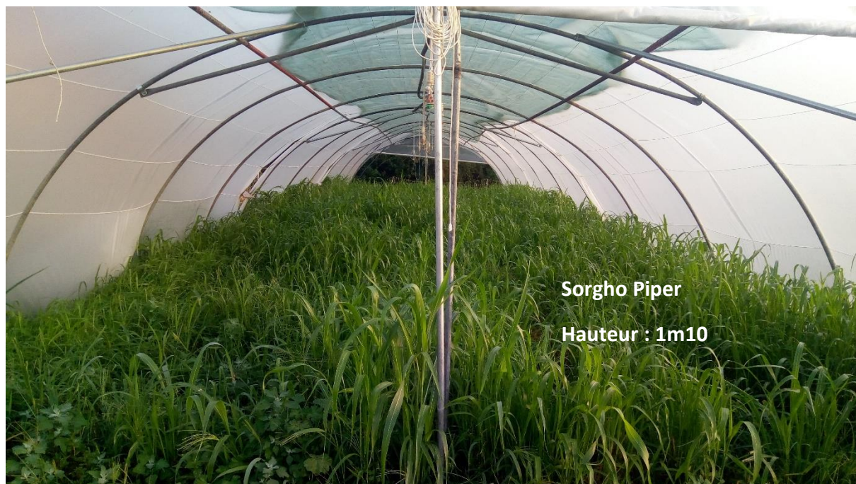
Figure 1 : Sorgho Piper au 31/07/20

Le sorgho a moins bien repoussé que les dernières fois, il paraît plus sale. A l'endroit des trois derniers prélèvements de biomasse le sorgho a peu poussé et les carrés d'1 m 2 identifiés par des ficelles bleues le 1 er juillet ne sont plus représentatifs de l'ensemble de la parcelle. Les zones de prélèvement ont donc été décalées d'1 mètre à gauche de la ficelle bleue pour être plus représentatives.