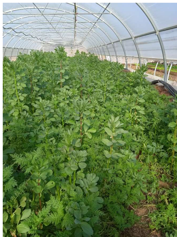
Photos prises le 17/02/23 : le radis et la phacélie sont très couvrants au sol, tandis que la féverole dépasse les 1m de hauteur

Mathieu est satisfait des deux couverts, de par leur bonne couverture et la grande production de biomasse. Il précise toutefois que ces couverts ont permis aux campagnols de se développer pendant l'hiver, ce sur quoi il faudrait être plus vigilant les saisons prochaines.